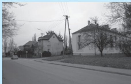
Nieruchomość na sprzedaż przy ul. Śniegonia.