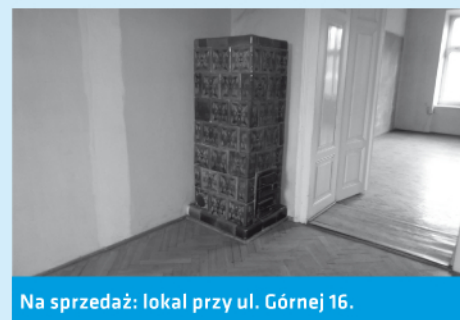
Na sprzedaż: lokal przy ul. Górnej 16.

Szczegółowe ogłoszenie o przetargu zostało zamieszczone na stronie internetowej bip.um.cieszyn.pl oraz na tablicy ogłoszeń UM w Cieszynie.